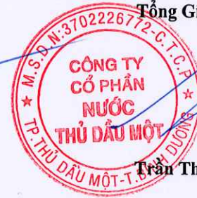
Trần Thế Hưng