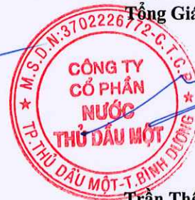
Trần Thế Hưng